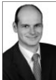
Christof Sommer Bürgermeister

der dritte Lippstädter Hansebrief macht in vielfältiger Form deutlich, dass der „Count Down“ für die Internationalen Hansetage 2007 in Lippstadt bereits lange angezählt ist. So präsentierte sich Lippstadt mit einer großen Delegation samt Stadtgründer „Edelherr Bernhard II.“ sowie einem Info-Stand mit heimischen Produkten und viel Wissenswertem über Lippstadt bei den Internationalen Hansetagen in Tartu/Estland. Gemeinsam mit der ausrichtenden Stadt der Internationalen Hansetage 2006, Osnabrück, gestaltete Lippstadt zudem in Tartu den „Städteabend“ und machte die vielen Delegierten aus über 100 Hansestädten neugierig auf eine Begegnung mit unserer schönen, traditionsreichen und gastfreundlichen Stadt.